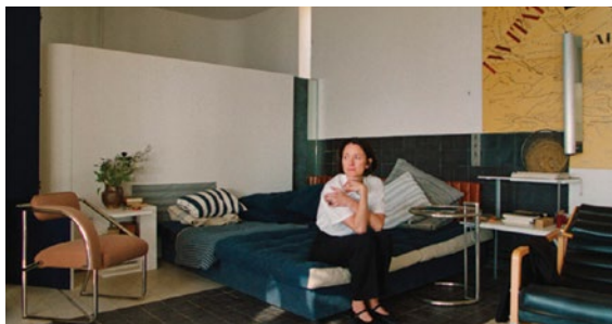
E. 1027 – Eileen Gray et la maison en bord de mer

Depuis 2016, Lieux Fictifs (Marseille) invite Image de ville à apporter une contribution à la programmation cinématographique développée au centre pénitentiaire des Baumettes. En 2019, le festival Image de ville a présenté les toutes premières séances de la nouvelle salle du Studio Image et Mouvement aménagée au sein de la Structure d'Accompagnement à la Sortie. En 2024, Image de ville et Lieux Fictifs poursuivent leur coopération culturelle. Du lundi 14 au vendredi 18 octobre, une sélection de la programmation des Rencontres d'Image de ville sera présentée au Studio Image et Mouvement.