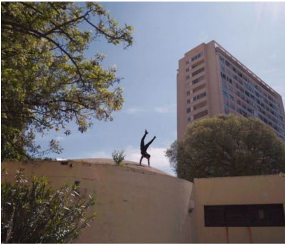
Écoute les murs tomber

Cette année, le philosophe de l'urbain Thierry Paquot convie deux personnalités pour une conversation quotidienne autour du renouveau des territoires et des bâtiments et à propos des nouvelles pratiques de l'architecture.